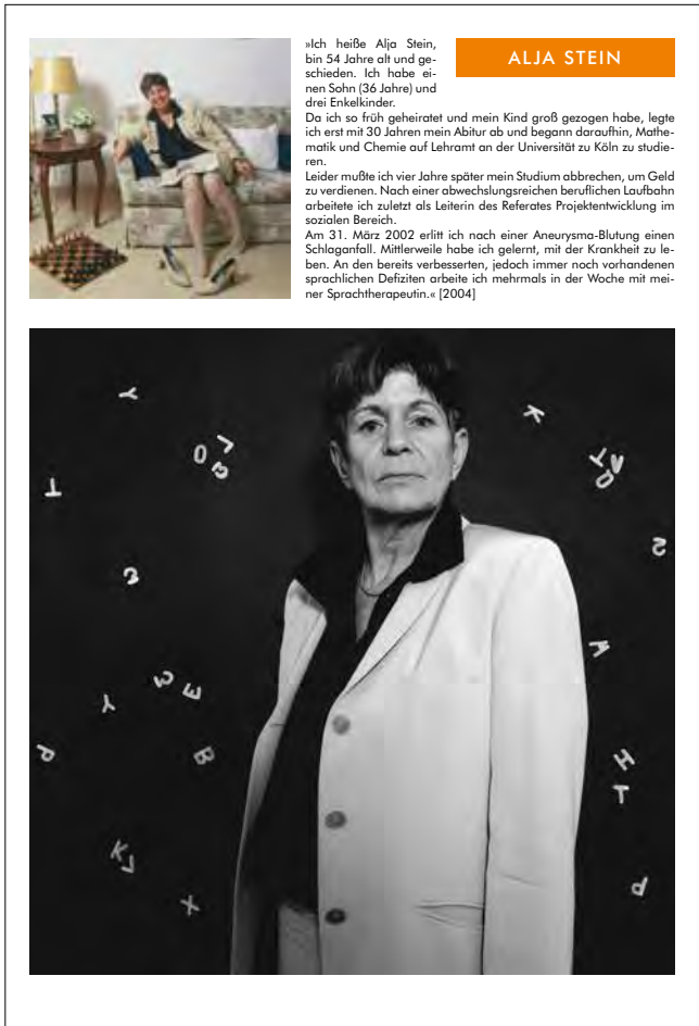
»Alja Stein« – Poster im Format A1 (594 x 841 mm), gedruckt auf 190 g Fotopapier, aus dem Bildband »Schlaganfall« von Michael Donner, € 14,50 inkl. MwSt., zzgl. Versand. Bestellung ber www.hippocampus.de → Therapiematerial → Poster