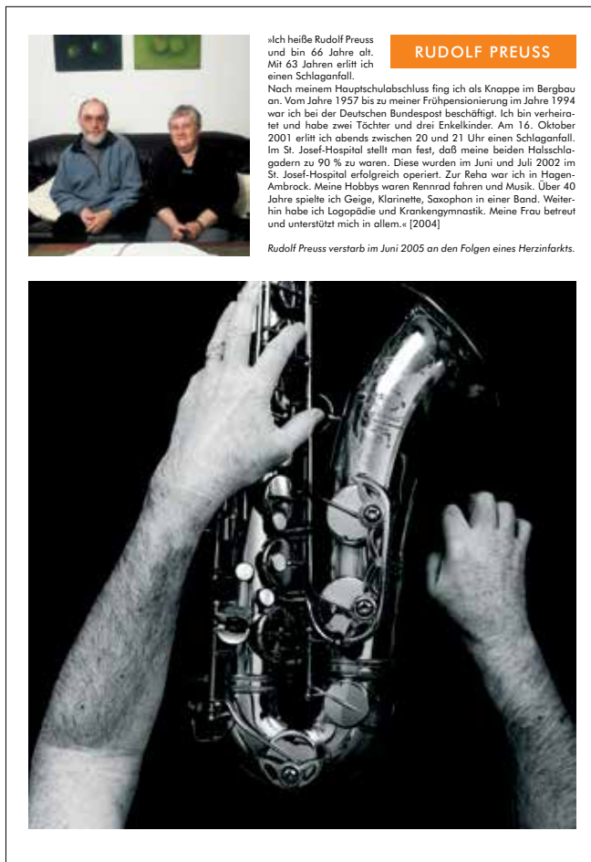
»Rudolf Preuss« – Poster im Format A1 (594 x 841 mm), gedruckt auf 190g Fotopapier, aus dem Bildband »Schlaganfall« von Michael Donner, € 19,50 inkl. MwSt., zzgl. Versand. Bestellung über www.hippocampus.de → Therapiematerial → Poster